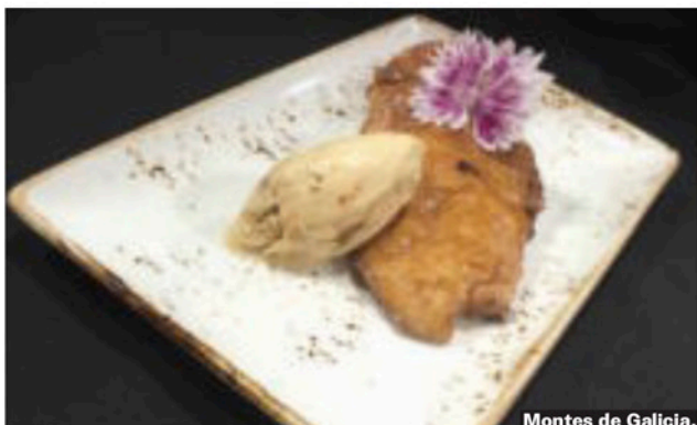
Montes de Galicia.